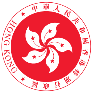
香港特別行政區區徽圖案